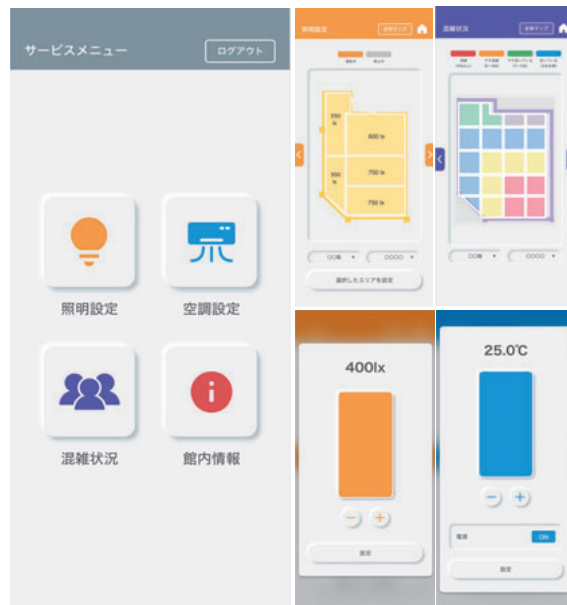
図4 スマホ操作画面 左からホーム画面、照明操作、混雑状況表示、空調操作

新鮮で近代的な印象を与える「ニューモフィズム」を採用し、「分かりやすいアイコン」を設けることで操作の誘発性や容易性を意識したUIデザインとした(図4)。