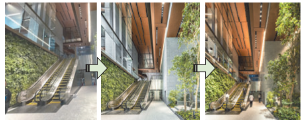
朝 色温度 5000K 調光率 100% 昼 色温度 4000K 調光率 100% 夕 色温度 3500K 調光率 80% 図2 1階エントランスサーカディアンリズム照明制御(一部)

サーカディアンリズム照明制御を導入し、自然光と同様に、午前中は高色温度・高照度、午後から徐々に色温度を下げることで省エネを図りつつ快適な光環境を実現した(図2)。一方、昼光が十分に入らない屋内の植栽育成には、一般的なLED照明では、光合成に必要な波長域の十分な放射強度が得られないため、光合成に特化した波長域を有する植物育成用照明を設置する必要があった(図3)。しかし、高輝度・高照度な植物育成照明単体ではグレアの懸念が考えられたため、午前中にサーカディアンリズム照明制御を行い、利用者の覚醒を促すことへの利用を考えた。植物と人の共生照明、「Symbiosis-Lighting」と名付けた。