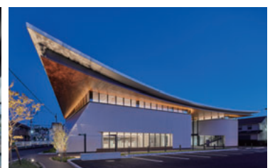
浜松いわた信用金庫蛸塚支店