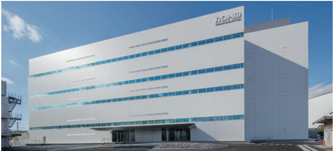
ローム・アポロSiC棟