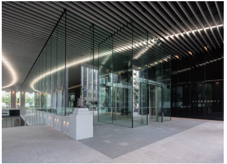
日本生命淀屋橋ビル