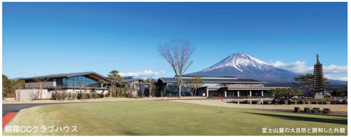
朝霧CCクラブハウス