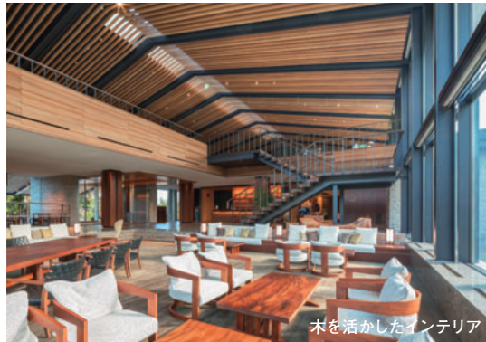
木を活かしたインテリア