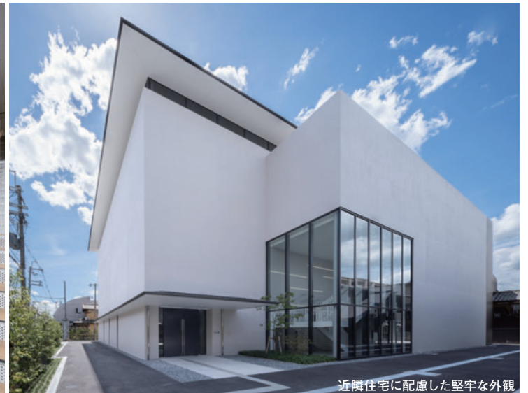
近隣住宅に配慮した堅牢な外観