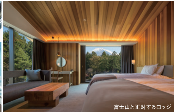
富士山と正対するロジ