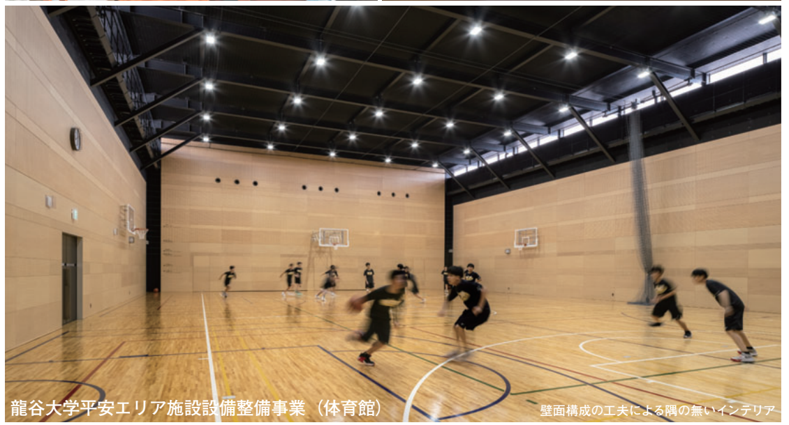
龍谷大学平安エリア施設設備整備事業 (体育館)