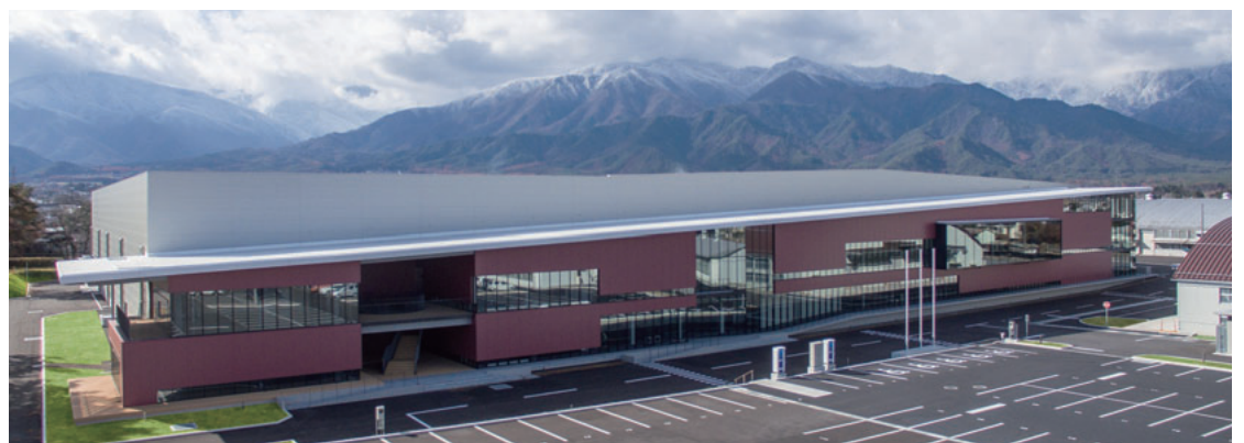
ハーモニック・ドライブ・システムズ有明工場新工場